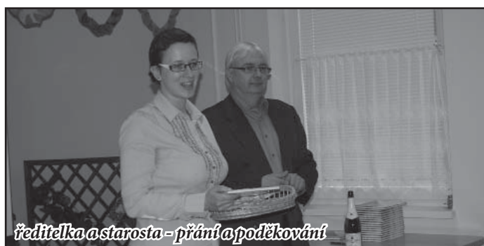
ředitelka a starosta - přání a poděkování

Každý dobrý počín by měl být řádně uveden na svět, a tak