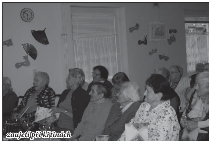
zaujetí při křtímách