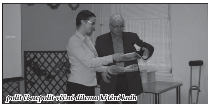
polít či nepolít věčné dilema křtěných knih