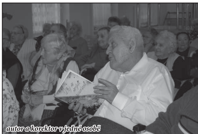
autor a korektor v jedné osobě