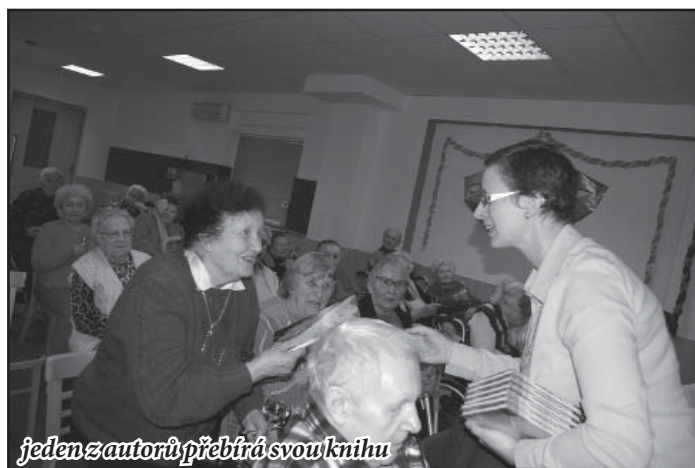
jeden z autorů přebírá svou knihu