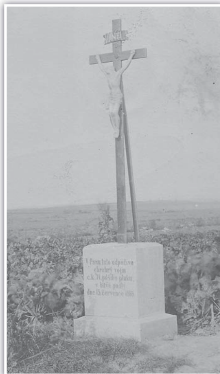
Dosud nepublikovaná fotografie kříže na Olomoucké ulici v Tovačově z dopisnice z roku 1905