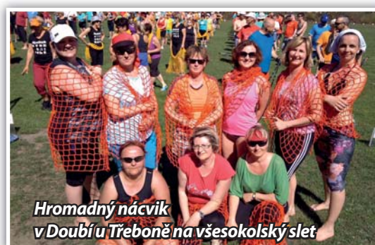
Hromadný nácvik v Doubí u Třeboně na všesokolský slet