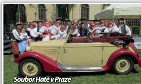
Soubor Hatě v Praze